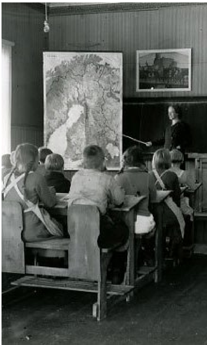
Specifinis susidomėjimas globaliuoju švietimu kilo XIX a. trečiajame dešimtmetyje. Geografijos pamoka 1930-aisiais

konfliktų prevencijos, tarpkultūrinį švietimą ir pilietiškumo ugdymą. Globaliojo švietimo veiklomis siekiama plėtoti asmens kompetencijas (žinias, gebėjimus ir vertybines nuostatas), kurių nemaža dalis priskirtinos bendrosioms arba perkeliamosioms asmens kompetencijoms, kurios gali būti pritaikomos įvairiose situacijose. Formaliajame ugdyme globalusis švietimas yra integruojamas į įvairias mokomąsias disciplinas (pavyzdžiui, istoriją, geografiją, pilietiškumo ugdymą, kitas socialinių ir gamtos mokslų disciplinas). Visuotinis švietimas nekuria naujo, o praturtina jau esamą turinį, suteikia ugdytiniams žinių apie globalizacijos procesus ir pasaulio visuomenės plėtrą.