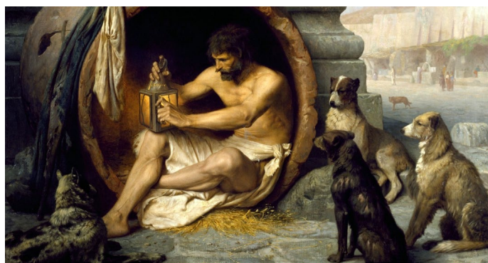
Filosofas Diogenas, kuris save pavadino pasaulio piliečiu © Jean-Léon Gérôme drobė

„Visuotinio švietimo turinys padeda suprasti besimokančiesiems pasaulinę perspektyvą ir pamatyti problemas bei galimybes viso pasaulio kontekste, skatina apmąstyti savo tapatybę, gyvenimo būdą ir priimti atsakomybę už save ir savo aplinką. Pasaulinės problemos vis dažniau veikia kiekvieno žmogaus gyvenimą, todėl visiems būtina suvokti, kad esame pasaulio, kuriame iki šiol vyrauja skurdas,