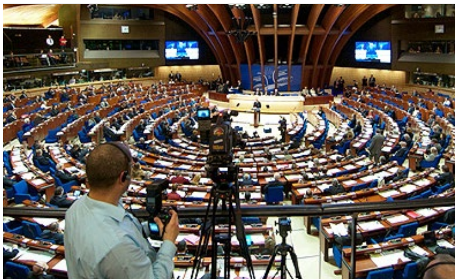
Europos Tarybos Parlamentinė asamblėja

Pastaraisiais dešimtmečiais į su švietimu dirbančių tarptautinių organi-